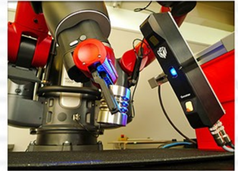
Inspections de pieces avec LMI et le robot collaboratif Baxter

• Une précision 3D et des possibilités incomparables D'un balayage 3D de premier ordre à des solutions d'inspections techniques – notre équipe d'experts est prête à répondre à vos besoins.