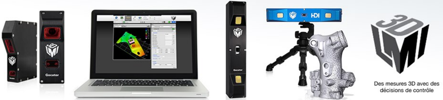
Des mesures 3D avec des décisions de contrôle

Avec un contrôle de la qualité et une optimisation des processus Demandez-nous à propos de LMI Technologies